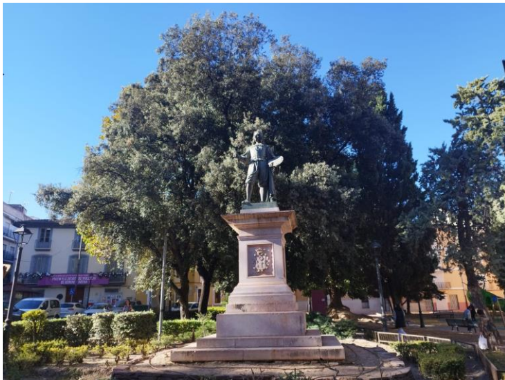
Josep de Ribera i Cucó: lo Spagnoletto

(Xàtiva, la Costera, 12 de gener de 1591 — Nàpols, 2 de setembre de 1652)