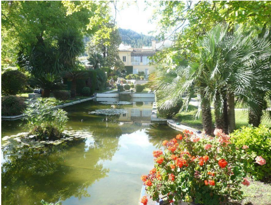
Imatge extreta del compte de Twitter de l’Ajuntament de Xàtiva @Xativa