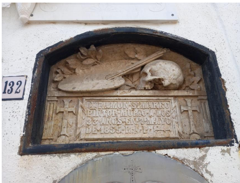
Tomba de Ramon Simarro, pare de Lluís Simarro Lacabra.

M'agradaria contar com eixe joc va perdre la gràcia. M'agradaria contar com es va convertir en un malson”. (2022: 11-12)