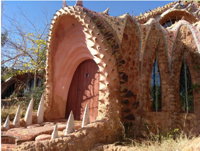
Imatge del Drac de la Calderona

Pujarem a l’autobús i ens posarem rumb al Drac de la Calderona. Aquest lloc no apareix al llibre que hem llegit, però ens sembla un lloc molt interessant per visitar. Es tracta d’un indret molt peculiar i artístic que trobem enmig de la serra, molt a prop del poble de Gilet.