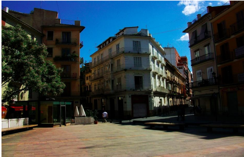
ANNEX 12. Setena parada. Plaça el Tossal.