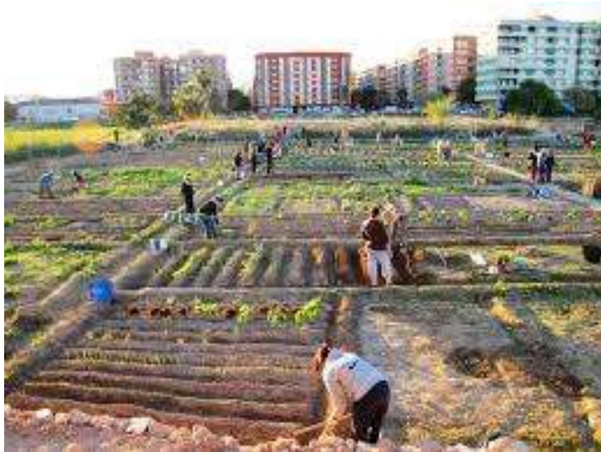
H. L'horta de Benimaclet