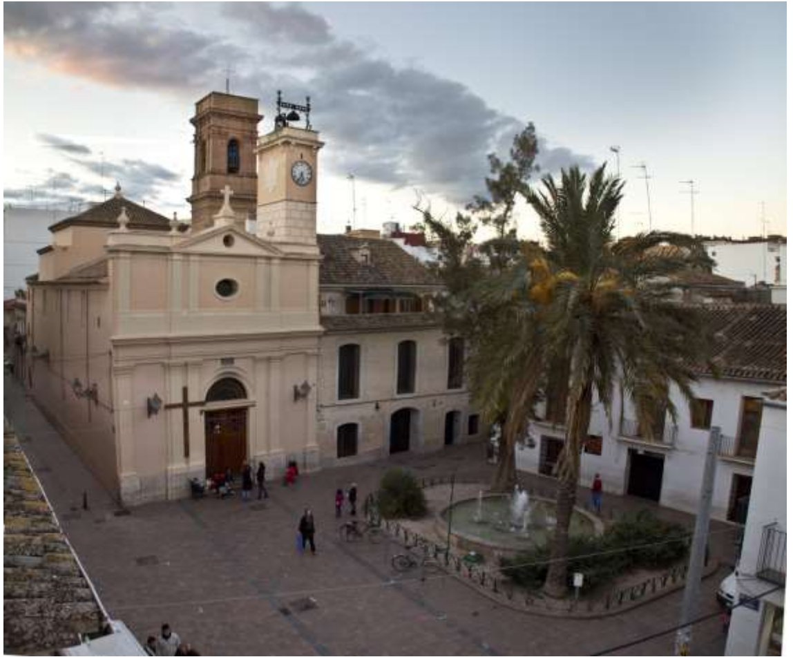
F. La plaça de Benimaclet