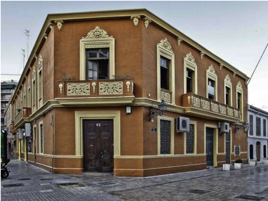
C. La Cooperativa (Antiga escola on va impartir classes)