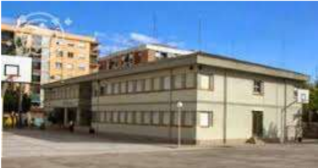
C. CEIP Carles Salvador