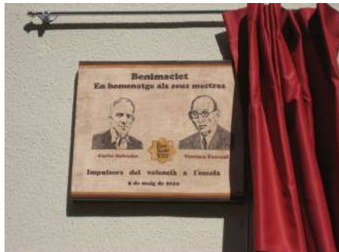
C. Placa homenatge al CEIP Carles Salvador