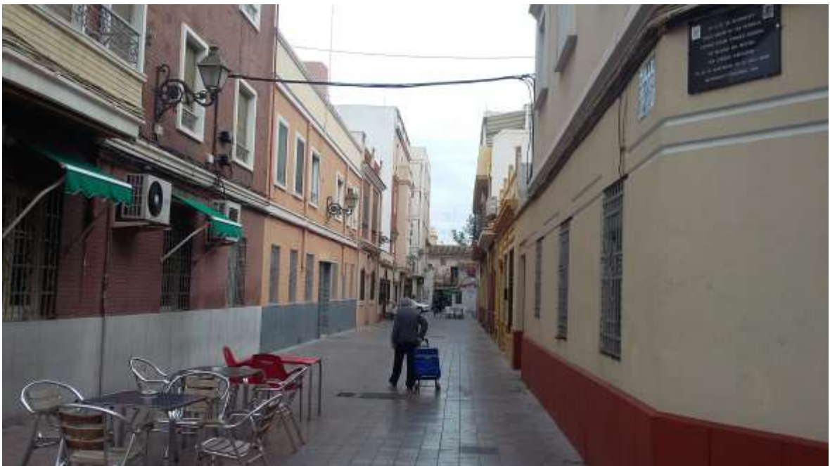
D. Carrer Carles Salvador