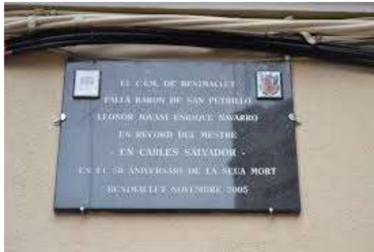
D. Placa Homenatge 50 anys