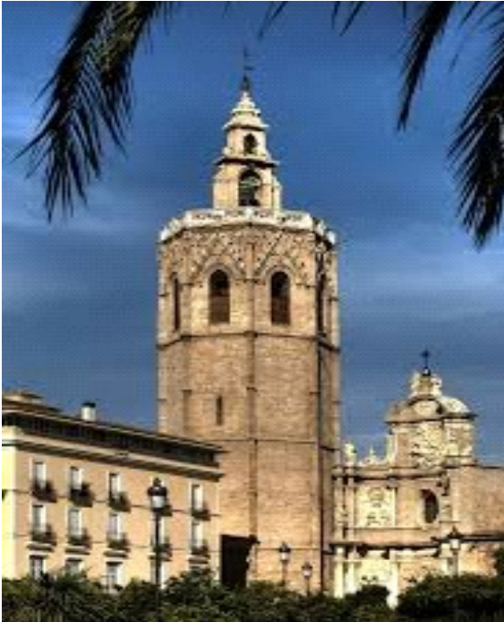
El Micalet i la Catedral de València.

En acabar de veure aquesta plaça ens dirigirem cap a la plaça de la Reina per a pujar al Micalet.