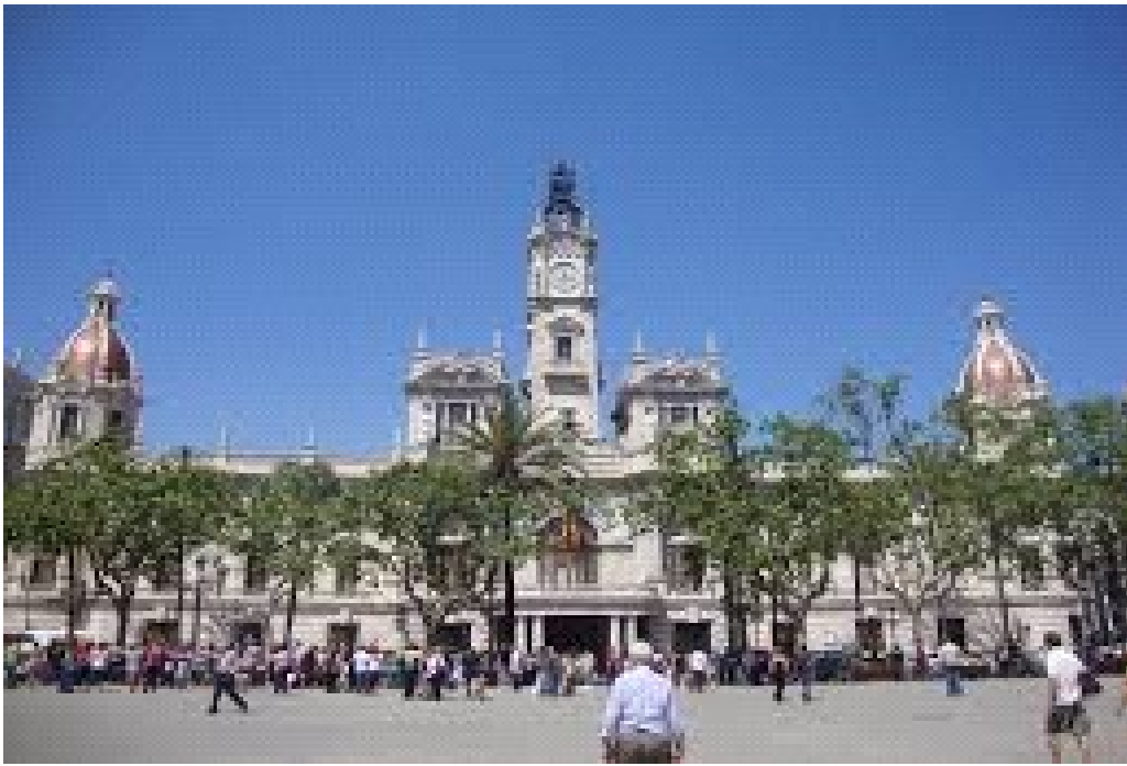
Plaça i edifici de l'Ajuntament.

L'edifici actual s'erigí al principi del segle XX (1905-1950), incorporant-hi l'antiga Casa de l'Ensenyança, un institut catòlic i l' Església de la Sang . L'estructura original, d'estil neoclàssic , encara es pot apreciar a la part de darrere. Fins al 1934 el consell municipal tenia com a seu l'antiga Casa de la Ciutat ja desaparegut a la Plaça de la Mare de Déu .