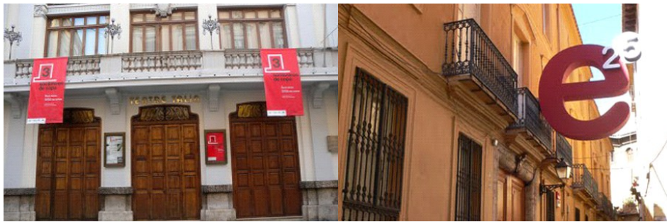
Teatre Talia i Teatre Escalante.