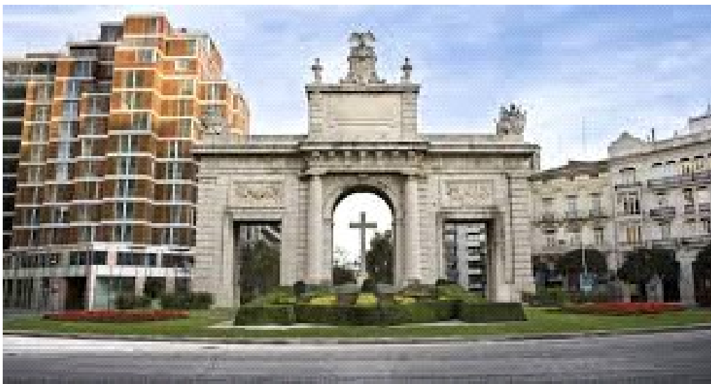
Porta de la Mar.

Iniciarem la ruta en la porta de la mar i creuarem cap al parc del parterre, per dirigir-nos cap al carrer La Pau.