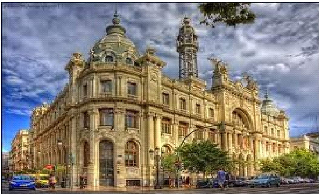
Edifici de Correus.

Després ens dirigirem pel carrer Sant Vicent cap a la Plaça de l'ajuntament, on veurem l'edifici de correus i el de l'ajuntament.