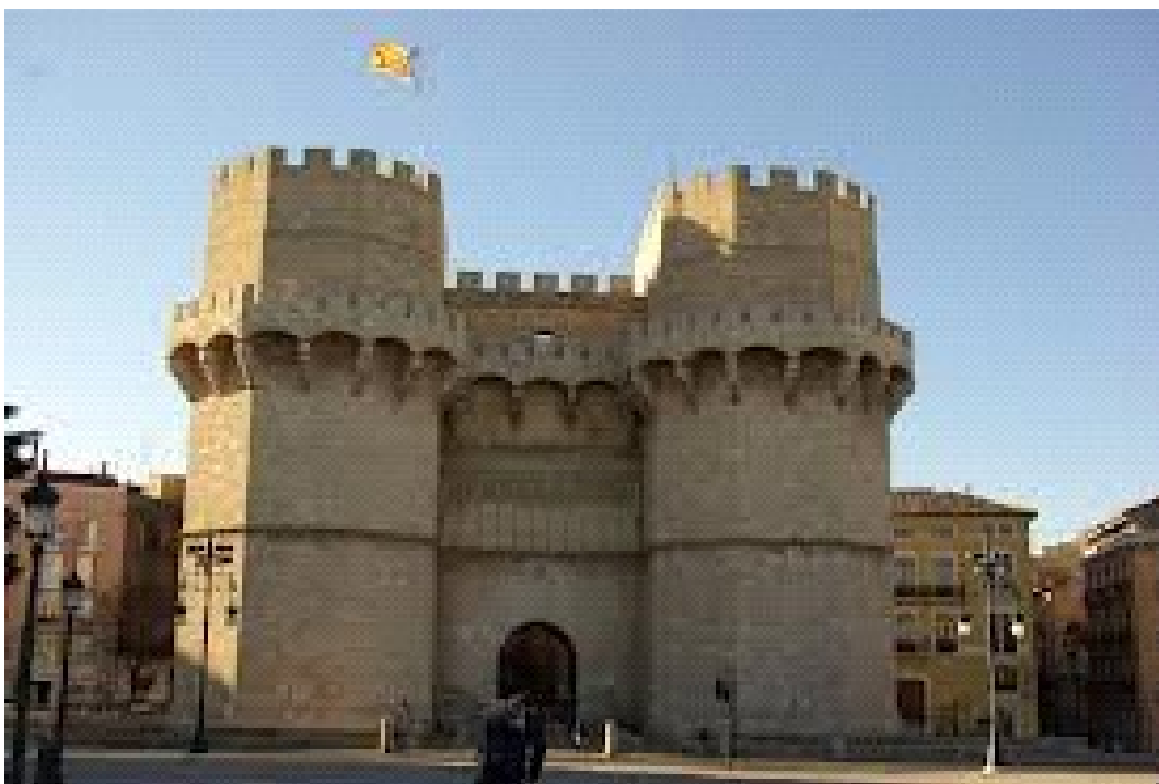
Torres de Serrans.

Des d'ací tornarem a la plaça de la verge i ens dirigirem cap a les portes de la ciutat, les Torres de Serrans