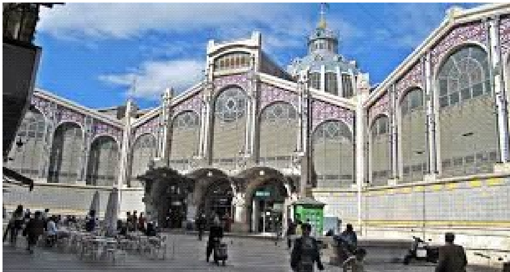
Mercat Central de València.

Després avançarem cap a la Plaça del Mercat per visitar el Mercat central i si volen els alumnes que es compren l'esmorzar.