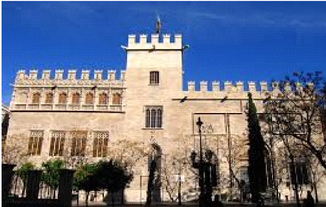
Llotja de la Seda.

En eixir del mercat creuarem a l'altra banda de carrer per visitar la Llotja de la Seda.